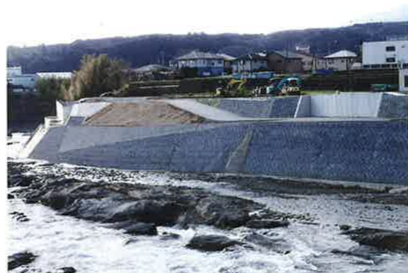
黄瀬川右岸工／裾野市