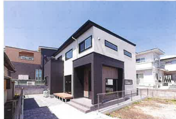
金山モデルハウス／裾野市