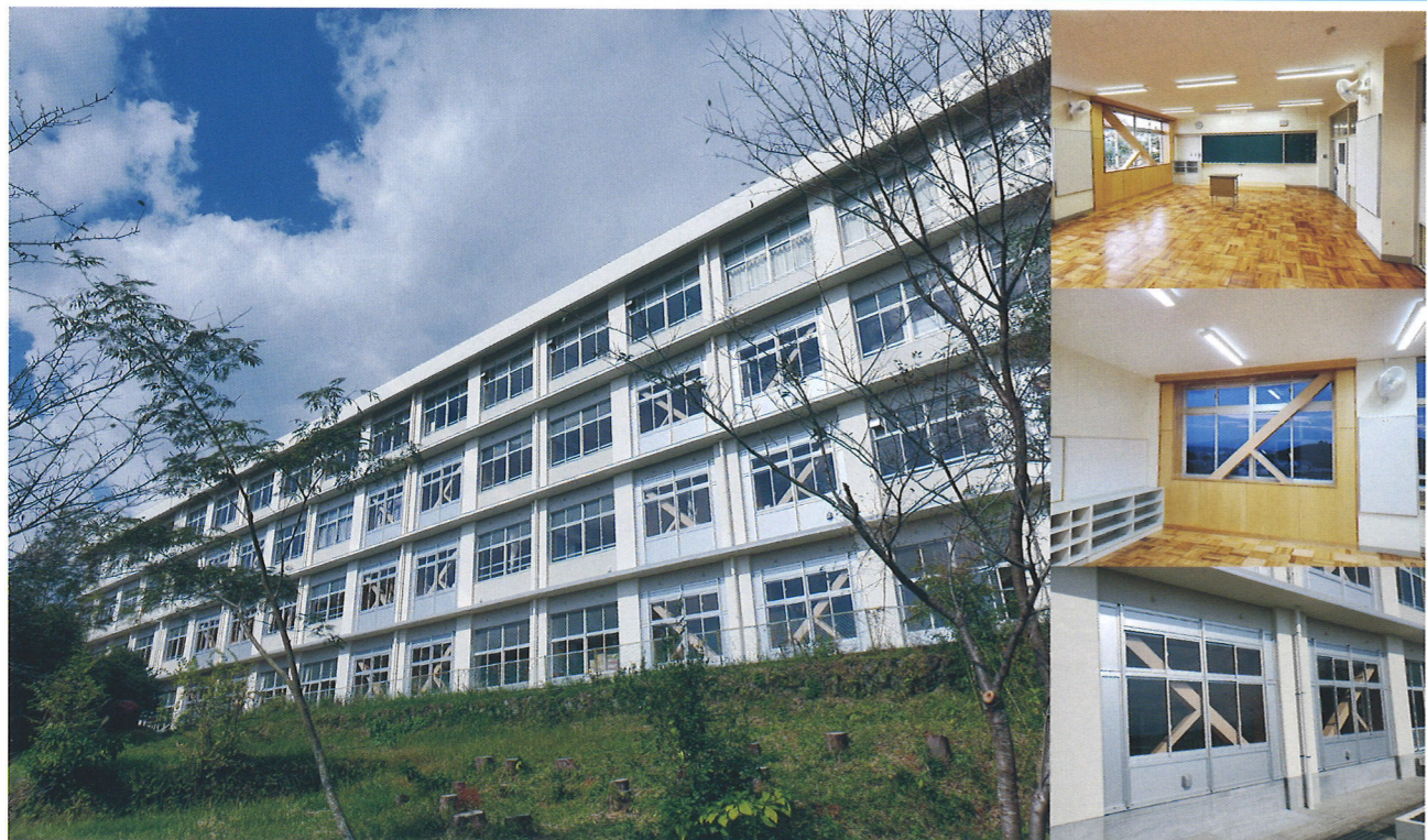
裾野市立富岡第一小学校耐震・大規模改造工事／裾野市

沼津工業高校企業研究 御殿場南中学校職場体験 住宅供給公社指定修繕業者表彰 建災防事業場賞表彰