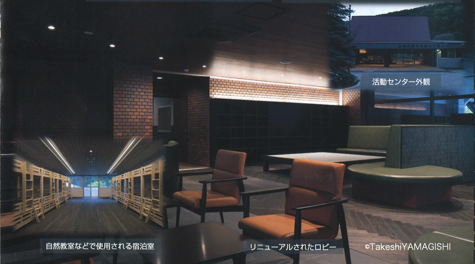
自然教室などで使用される宿泊室