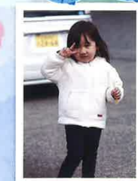
初めての体験。 ワクワクドキドキ、楽しみ!