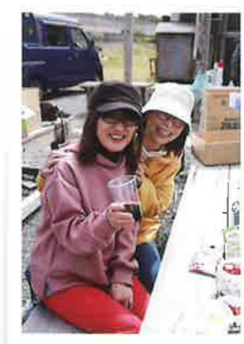
労働の後の一杯は これしかないw (※ノンアルコールです)