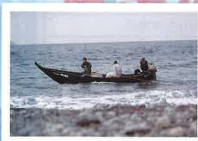
いざ、出船! 網配置に皆で大漁願う!!