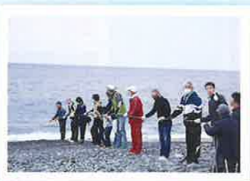
地引き(網引き?)開始! まだまだ先は長い... みんなで力を合わせて頑張ろう!