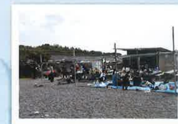
大勢の参加者 皆さんお疲れ様でした!