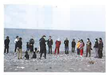
今日は絶好の地引網日和!! 安全第一で楽しもう!