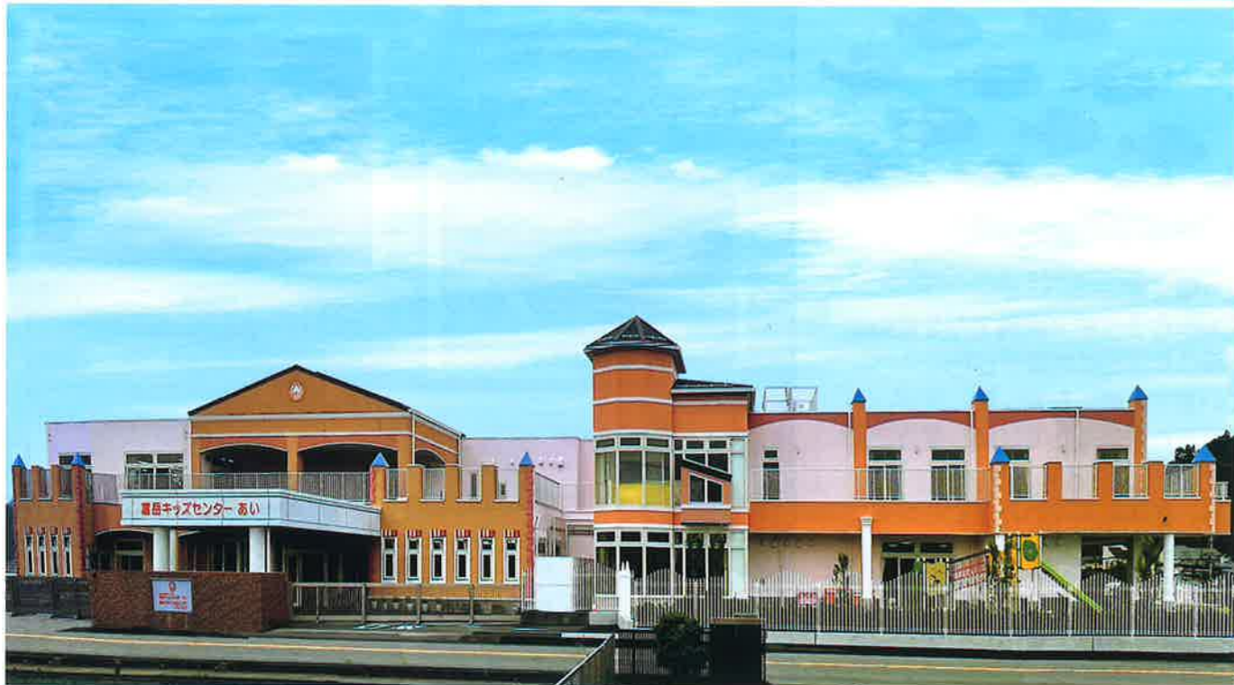
富岳キッズセンターあい 増築／裾野市

富岳キッズセンター あい 竣工式 病児保育室 りんりん 開所式 組織変更に伴う本社レイアウト変更