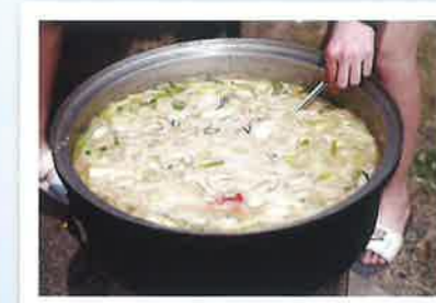
魚介出汁と野菜豊富なあら汁。 美味しそー!!