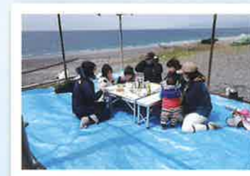
家族サービス。 子供たちも貴重な体験、 楽しんでいました。