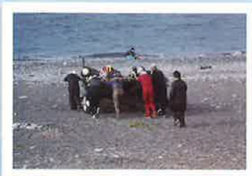
皆で出船準備! 舟を押して海を目指す!!