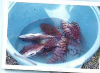
大漁!!! 皆で力を合わせて頑張りました!