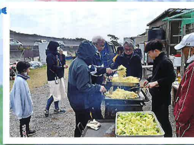
使った体力は食事で回復。 大量の焼きそば美味しかったです!