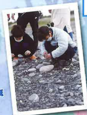
待ち時間。 網を引く以外も楽しめます!