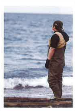
見た目は漁師そのものw 大漁なら嬉しいな!